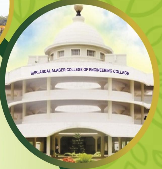
SHRI ANDAL ALAGER COLLEGE OF ENGINEERING COLLEGE