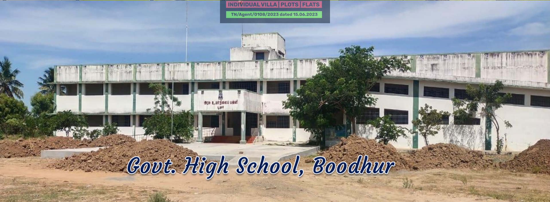
Govt. High School, Boodhur

Call Us +918148001647 INDIVIDUAL VILLA | PLOTS | FLATS TN/Agent/0108/2023 dated 15.06.2023